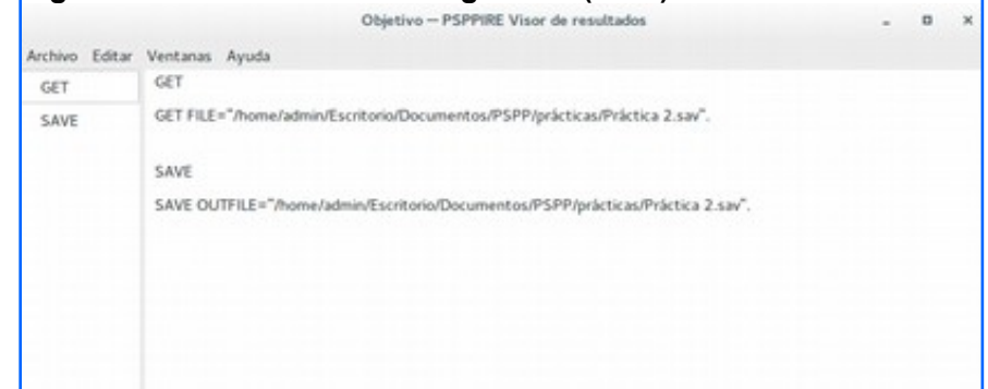
Figura 2: Visor de resultados: guardar (save).

En el visor de resultados puede verificar que el archivo fue guardado de forma exitosa.