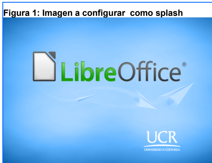
Figura 1: Imagen a configurar como splash