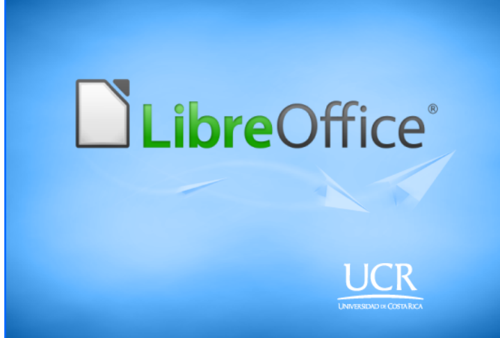
Figura 1: Imagen a configurar como splash