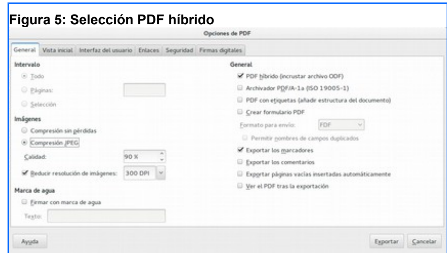
Figura 5: Selección PDF híbrido