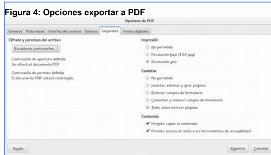
Figura 4: Opciones exportar a PDF

Se despliega un cuadro de diálogo con diferentes alternativas para almacenar el documento, por ejemplo, en la pestaña seguridad , puede establecer contraseñas para evitar el copiado e impresión del documento.