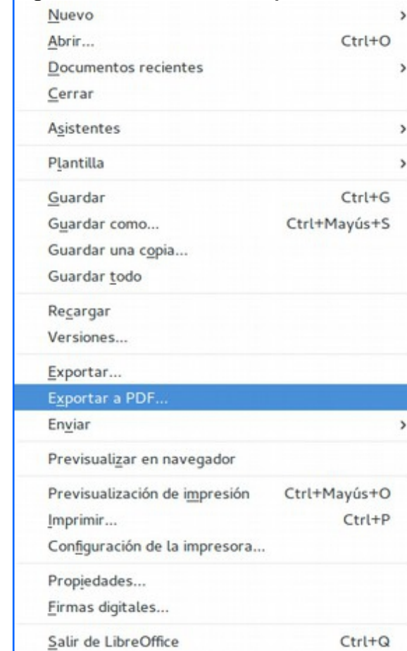
Figura 3: Menú Archivo - Exportar a PDF..