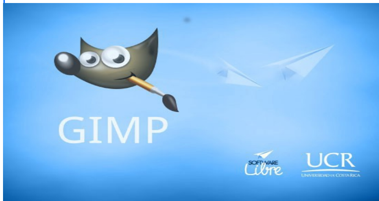
Figura 1: Imagen ejemplo de Splash